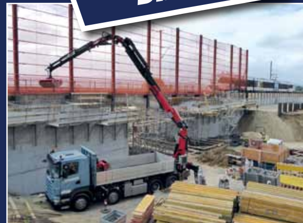
16 m Greifer-Kran