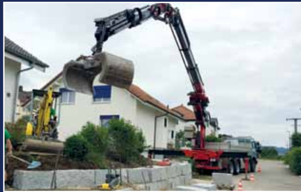
Bau einer Steinmauer mit Steingreifer

Breite: von 60 cm – 160 cm Inhalt: von 400 l – 800 l