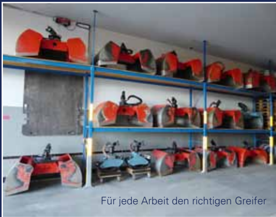
Für jede Arbeit den richtigen Greifer