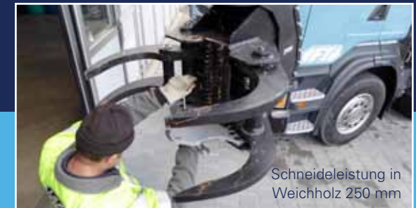
Schneidleistung in Weichholz 250 mm