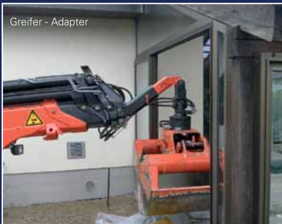
Greifer - Adapter