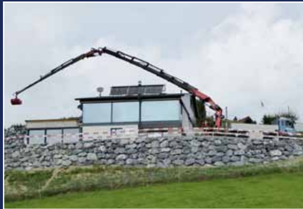
Bis 32 m Ausladung